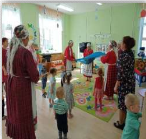
День народного единства