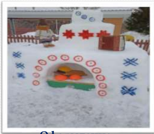
Оформление зимнего участка с использованием удмуртского орнамента