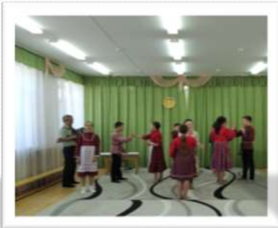
У нас в гостях ансамбли «Шундысиос» и «Дарали»