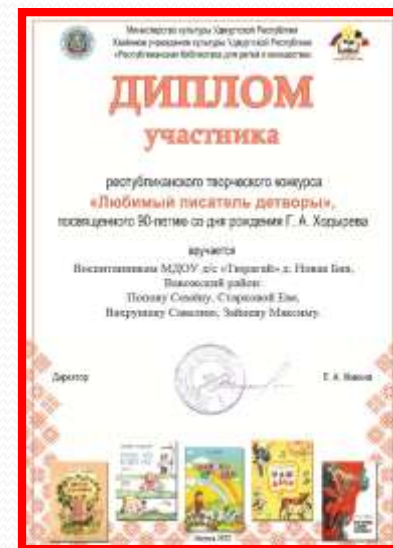
«Любимый писатель детворы» республиканский конкурс.