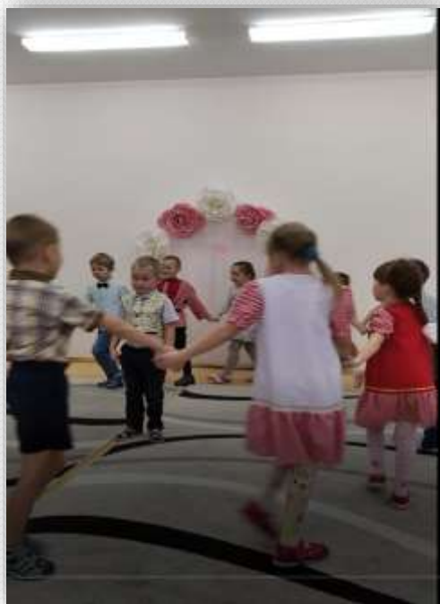
Знакомство с творчеством Кузубая Герда