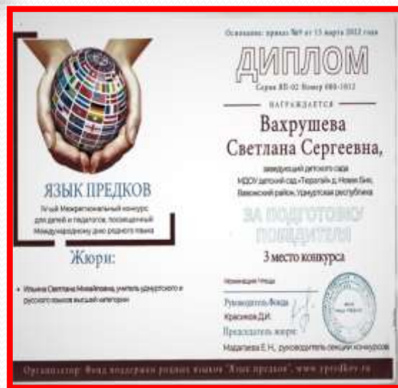
Всероссийский конкурс чтецов «Язык предков» 3 степени