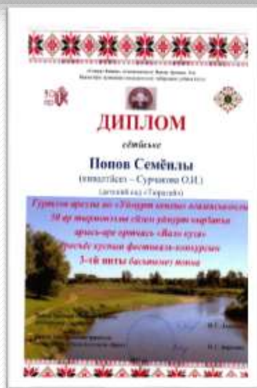
«Вало кузя» 3 место