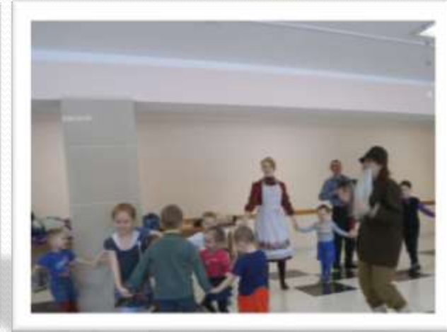
В гостях у Лопшо Педуня