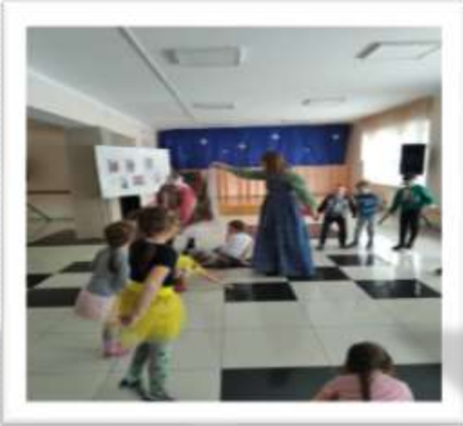
День государственности Удмуртии