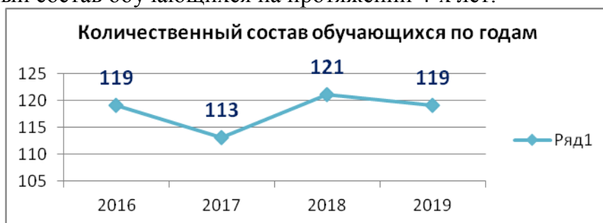
Рисунок 1. Количественный состав обучающихся по годам

Динамика численности учащихся за последние 4 года показывает стабильный количественный состав обучающихся на протяжении 4-х лет.